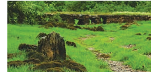
수바야를 지나는 스투트 크로스