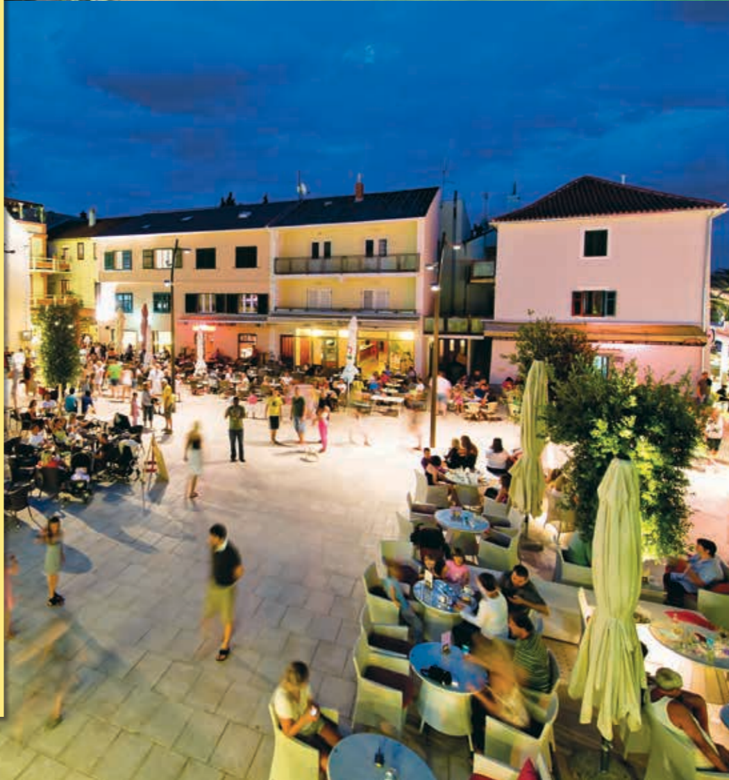
위 사진: 즈르체 비치 아래 사진: 노발야