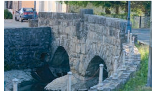
가테 야루가를 가로지르는 석조 다리(1801년 축조)