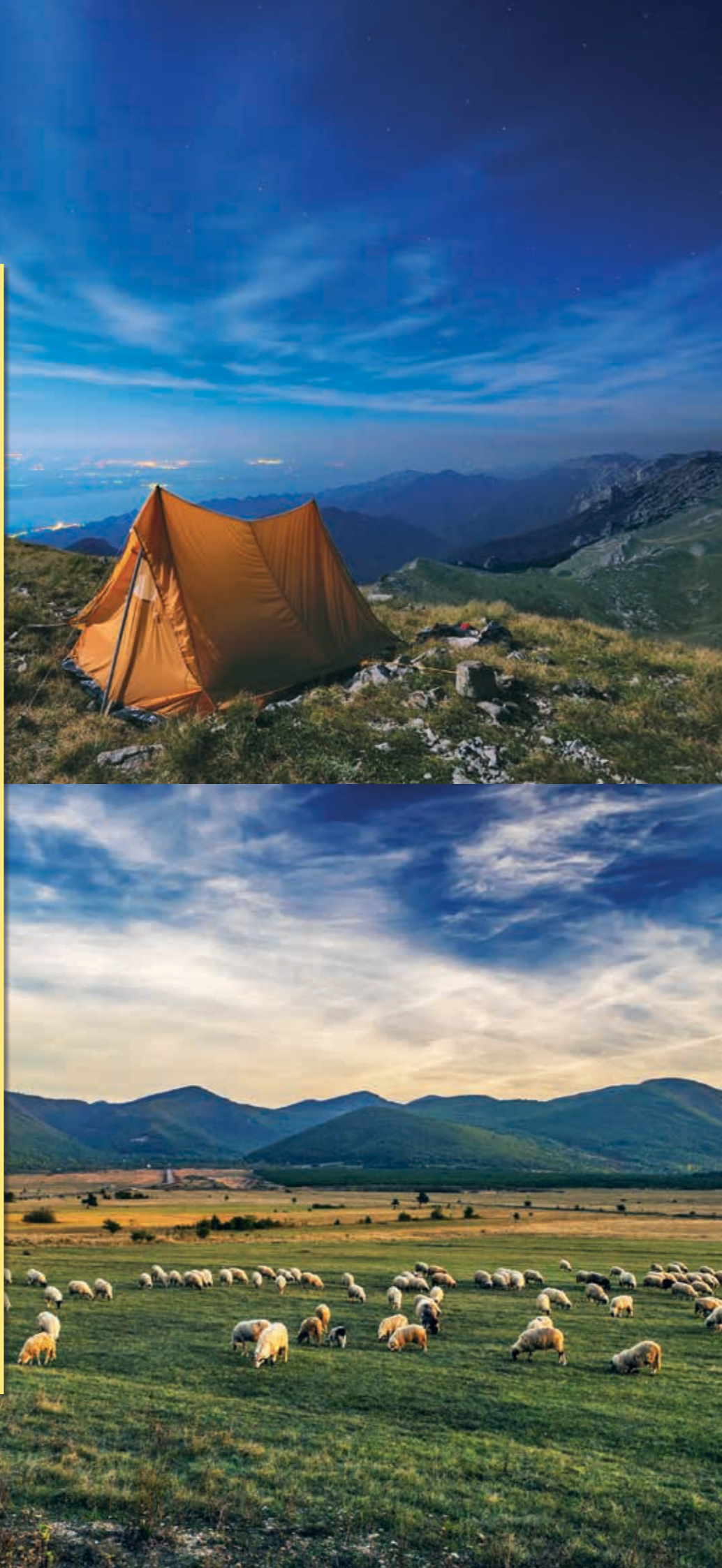
아래 사진: 로비나츠