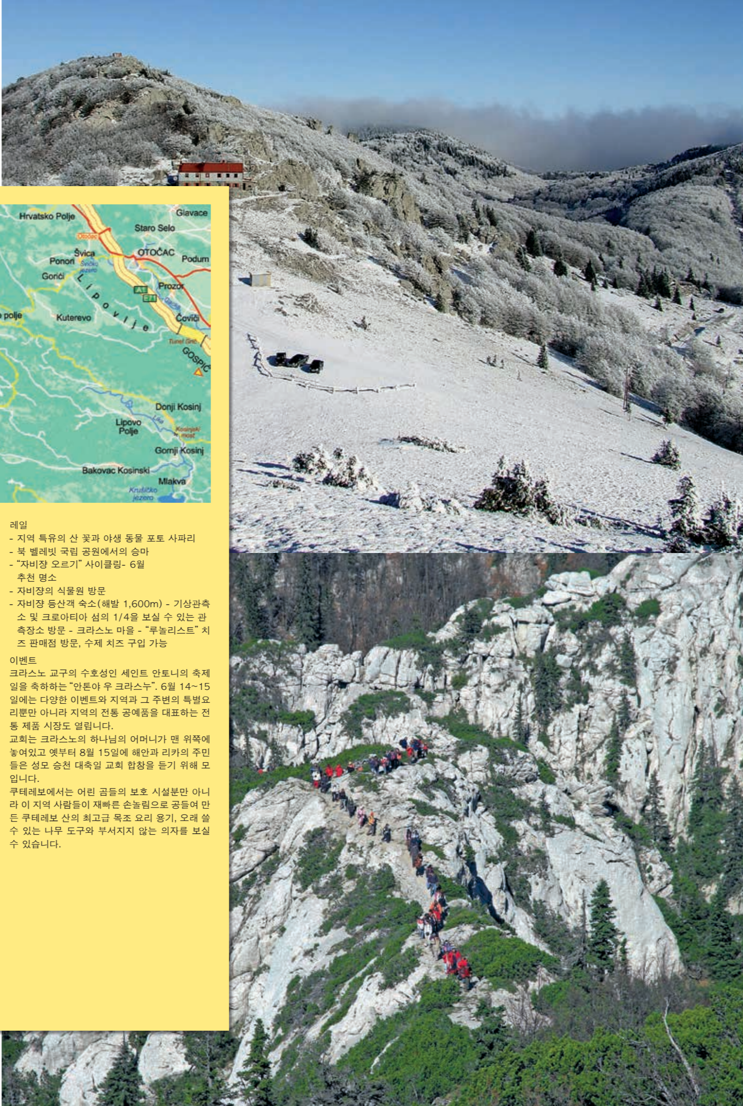
위 사진: 북 벨레빗 NP 입구 아래 사진: 프레즈치치 트레일

관광 정보: 불만한 곳 북 벨레빗 국립 공원 내 - 1,392m 길이의 루키네 동굴, 1,320m의 슬로바츠키 동굴 및 벨레빗 자연공원이 있는 로잔스키 및 하이두츠키 쿠코비.