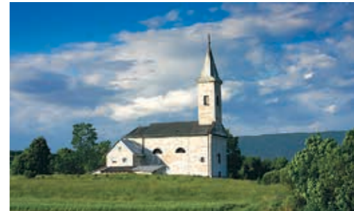
나사스차 교회sv.크리자 1820, 크리즈폴예