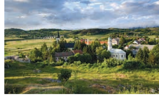
소콜라츠 마을에서 본 브링예